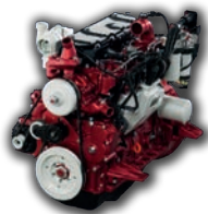
STARK OCH EKONOMISK

Lännen 8800i, som är den starkaste maskinen i sin viktclass, är utrustad med en ekonomisk och tillförlitlig fyrcylindrig Agco Power 49 AWI dieselmotor. 27. Motor effekt 124 kW och den uppfyller miljökrav steg 3B. Vridmomentet på 700 Nm uppnås redan vid 1300 r/min.