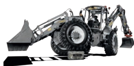
GODA TERRÄNG EGENSKAPER

Den dimensionerade, starka körtransmissionen ger maskinen en bra dragkraft och en transport hastighet på 45 km/h. De här egenskaperna med den nya arbetshydrauliken och CAN BUS systemet minskar bränsleförbrukningen upp till 10 %.