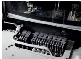
LASTAVKÄNNANDE ARBETSHYDRAULIK OCH TRANSMISSION

Det förlängda axelavståndet till 2700 mm ger maskinen en bra stabilitet under transport och höga hastigheter upp till 45 km/h. Gör det möjligt att snabbt och smidigt flytta maskinen mellan olika arbetsplatser.